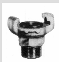
Utvändig gänga BSP 3003