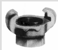
Invändig gänga BSP 3002